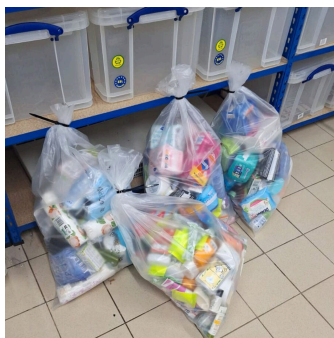
Tour CBX, du 4 mars février au 2 avril à La Défense