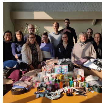
Valoxy, le 8 mars à Lille