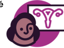
Sage-femme et gynécologue