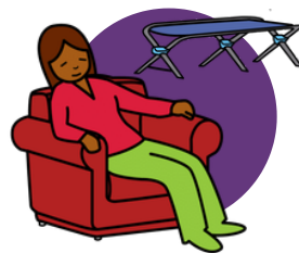
Salle de repos