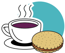
Boisson chaude et collation