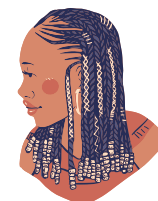
Socio-esthétique et coiffure