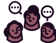
Groupes de parole

L'ADSF vous propose un ensemble d'activités et d'ateliers pour prendre soin de vous