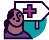
Médiatrice en santé

Une équipe de professionnelles vous reçoit pour évaluer vos besoins, vous accompagner et vous orienter